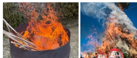
こうした「たき火」も制限対象

春に向け、枯れ草などの野焼きを見かけますが自らが火元となったり、違反で罰せられることのないよう火の取り扱いには注意しましょう。