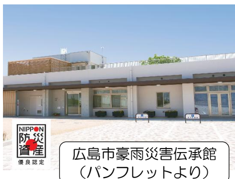
広島市豪雨災害伝承館 (パンフレットより)

前号で予告しました視察研修、今回の行き先は広島市。防災研修を兼ね【広島市豪雨災害伝承館】を訪ねます。