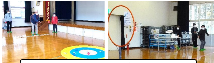
室内レクも体験。ワイワイ楽しくできました

まずは隣の地区のサロンでもいいので、一度参加をしてみることから始めてみませんか。おしゃべりするだけでもきっと楽しいですよ！