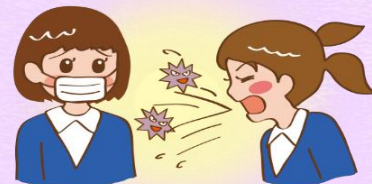
飛沫感染を防ぐため マスクの着用