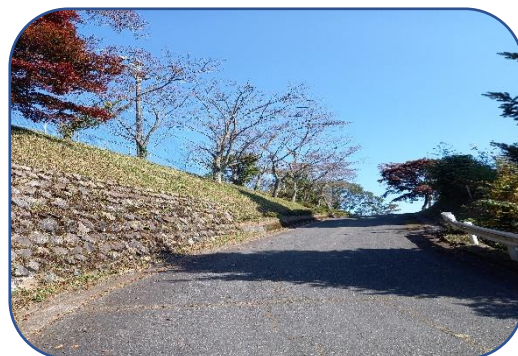
草刈の後きれいに掃除していただきました