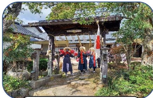
10月26日は森白鬚神社の秋祭り

秋の収穫がほとんど終わって、今年も秋祭りのシーズンがやってきました。日本古来の文化として、昔から地域の一大行事として伝承されてきました。最近では人口減少によって祭りの規模は小さくなっていますが、脈々として引き継がれている村祭りが終わるといよいよ寒い冬がやってきます。