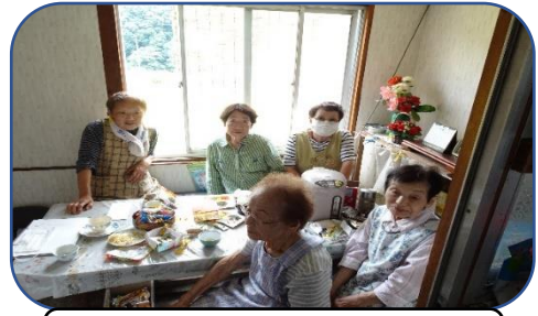
友気サロンのみなさん

八幡地域では、地域単位でサロン活動として茶話会の開催や健康体操などに取り組んでおられますので紹介します。今回は菅地区の友気サロンです。会員は7名で毎月第2木曜日にみんなで集まってお茶会をされています。お伺いした日には2名欠席されていましたが、お茶菓をいただきながら朝の時間を楽しくおしゃべりで過ごされていました。