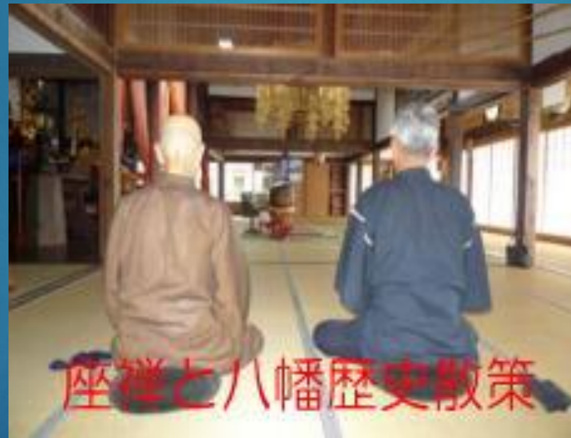
座禅と八幡歴史散策