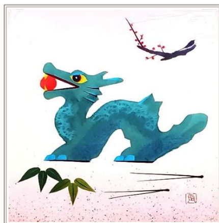
干支のちぎり絵（曾利敏江先生 作）