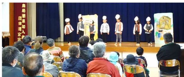
可愛らしいぼんぼこ山保育園児の演劇