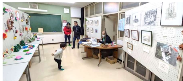
展示もたくさん飾られました