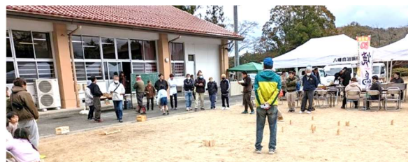
「モルック」でワイワイ競い合い!