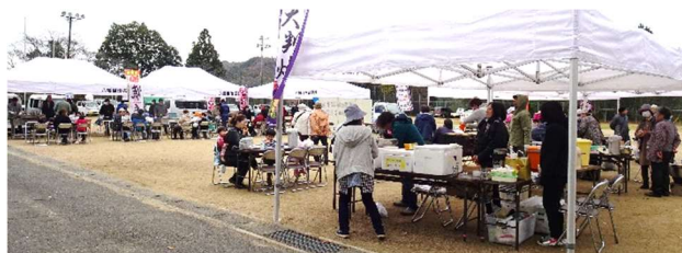
「食」のコーナーも色々出店いただきました