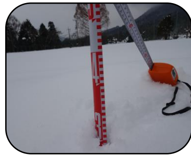
積雪 30 センチ

保田の塩の滝を撮影しました。氷点下9度、最近にない低温でした。 (1月8日撮影)