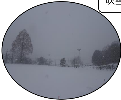
吹雪の振興センター

1月8日には、強い風と雪が吹き荒れました。雪一面のグラウンドも30センチの積雪です。