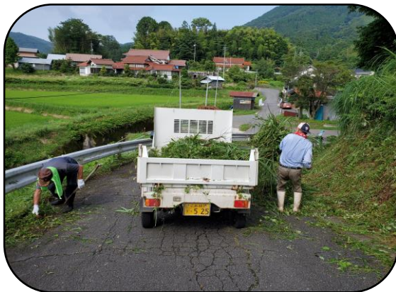
進入路がきれいになりました

環境整備の後、飯山会の皆さんには健康寿命向上セミナーを受講していただきました。高齢になるにつれて、心身の衰えはないかチェックすることや健康体操を指導していただきました。飯山会の皆さんは60代~70代の会員で構成されていますから、皆さんまだまだ元気で活躍されている方ばかりです。今回のセミナーは、草刈り作業後のストレッチ体操も兼ねていたので、身体のアフターケアになりました。普段の農作業後にも取り入れてみてはいかがでしょうか。