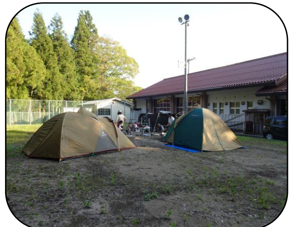
テント設営してキャンプ場に