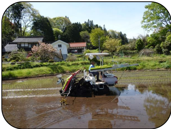
大型機械による田植え風景

連休前に、地域の若者から振興センターでキャンプをしてよいかとの相談がありました。コロナ禍でキャンプ場の予約は満員とのこと。要望にこたえてグラウンドを提供しました。みなさんそれぞれキャンプ用品を持参のうえ、料理にとりかかっていました。振興センターもキャンプ場として使用できることを認識しました。今後もキャンプ地としての要望にこたえることはもちろん、振興区事業として検討していいかも？