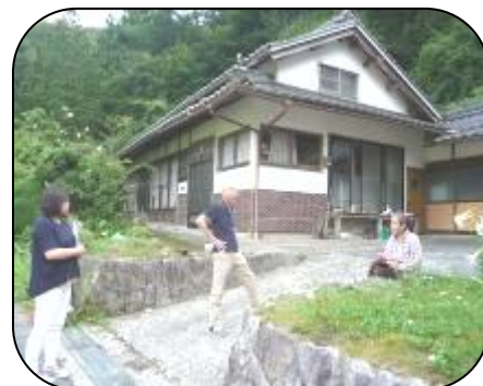
菅地区線路沿いに毎年ひまわりの植栽をされています。