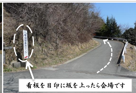
看板を目印に坂を上ったら会場です