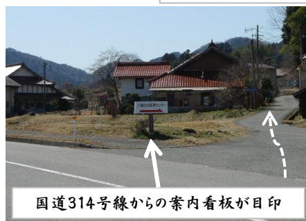
国道314号線からの案内看板が目印